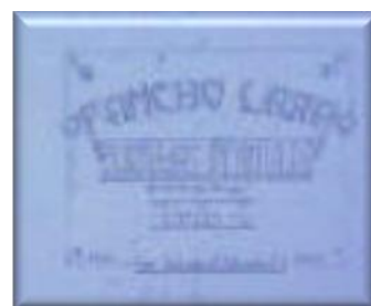
BURBUJAS INFANTILES, EDITADO EN EL AÑO 1961 TOMO I, CONTENIENDO CANCIONES INFANTILES.