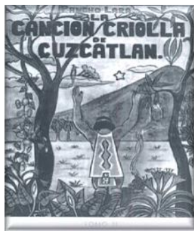
LA CANCIÓN CRIOLLA DE CUSCATLÁN TOMO II EDITADO EN EL AÑO 1948.