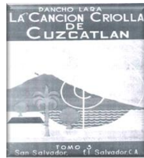
LA CANCIÓN CRIOLLA DE CUSCATLÁN TOMO III EDITADO EN EL AÑO 1958.