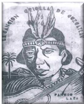
FOLLETO DE LA CANCIÓN CRIOLLA DE CUSCATLÁN CON MOTIVOS REGIONALES, ROMÁNTICOS, INFANTILES, EDITADO EN EL AÑO 1937.