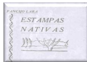
ESTAMPAS NATIVAS, EDITADO EN EL AÑO 1944 CONTENIENDO PROSAS POÉTICAS Y CANCIONES.