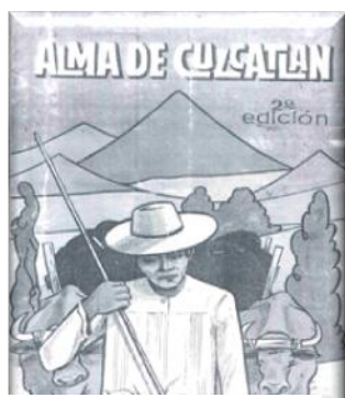
ALMA DE CUSCATLÁN 2ª EDICIÓN EDITADO EN EL AÑO 1967.